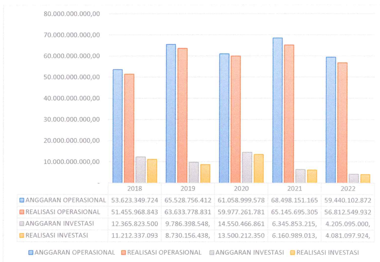
Gambar 1 Anggaran dan Realisasi Belanja Operasional dan Belanja Investasi Rumah Sakit Mata Bali Mandara Tahun 2018 – 2022